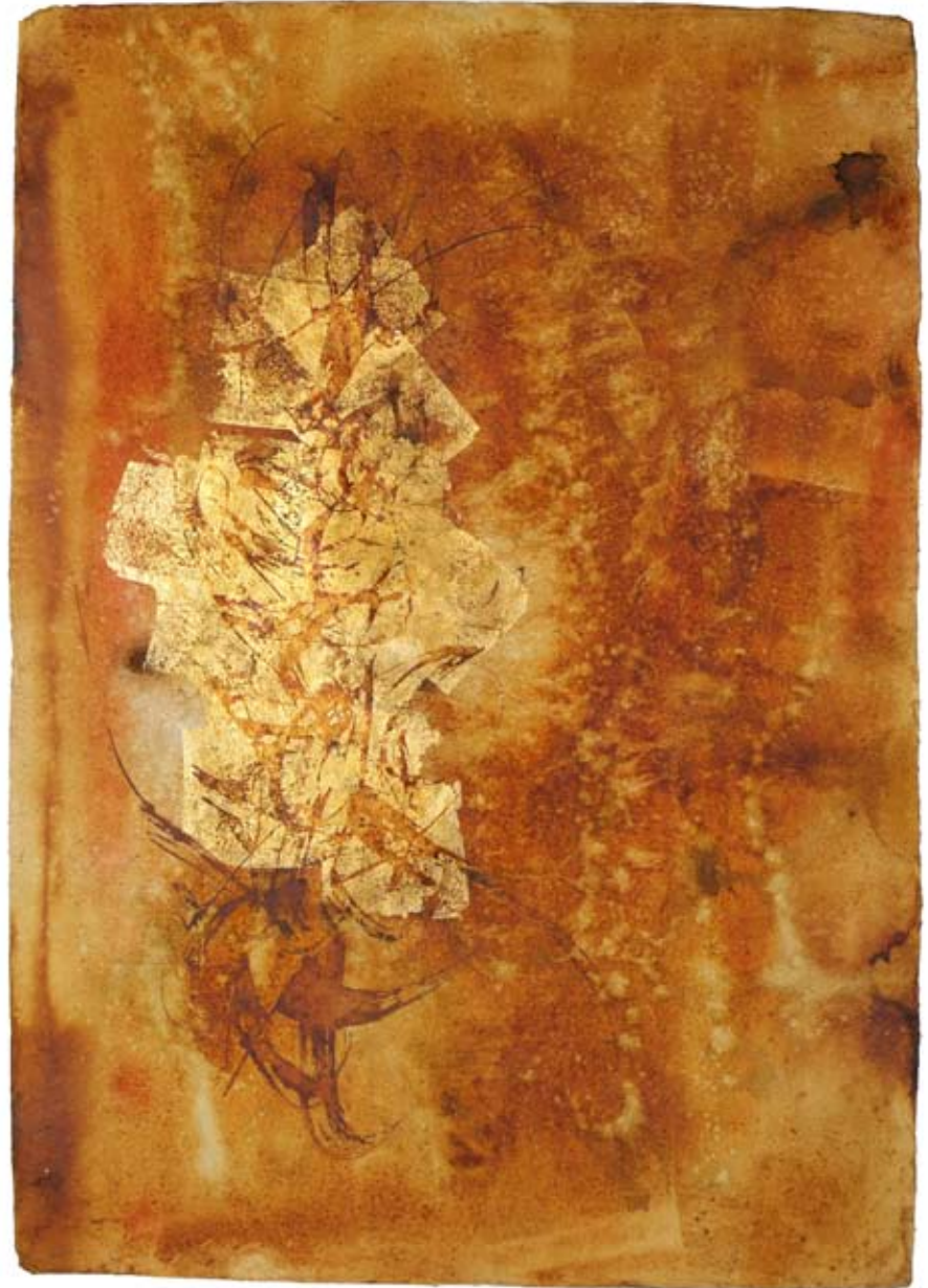
„Verlorene Leichtigkeit“, Acryl und Schlagmetall auf handgeschöpftem Papier, ca. 94 x 134 cm, 2008