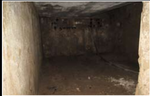
RAUM vorher - nachher