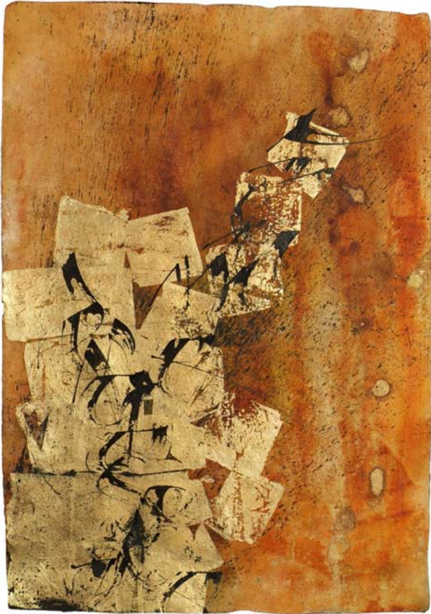
„Vergessene Träume“, Acryl und Schlagmetall auf handgeschöpftem Papier, ca. 94 x 134 cm, 2008