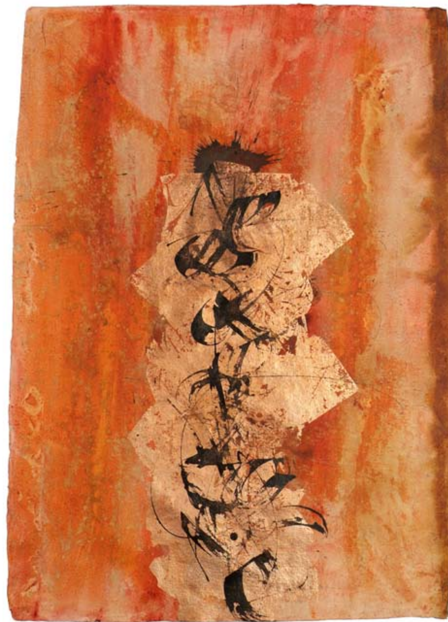
„Versteckte Gefühle“, Acryl und Schlagmetall auf handgeschöpftem Papier, ca. 94 x 134 cm, 2008