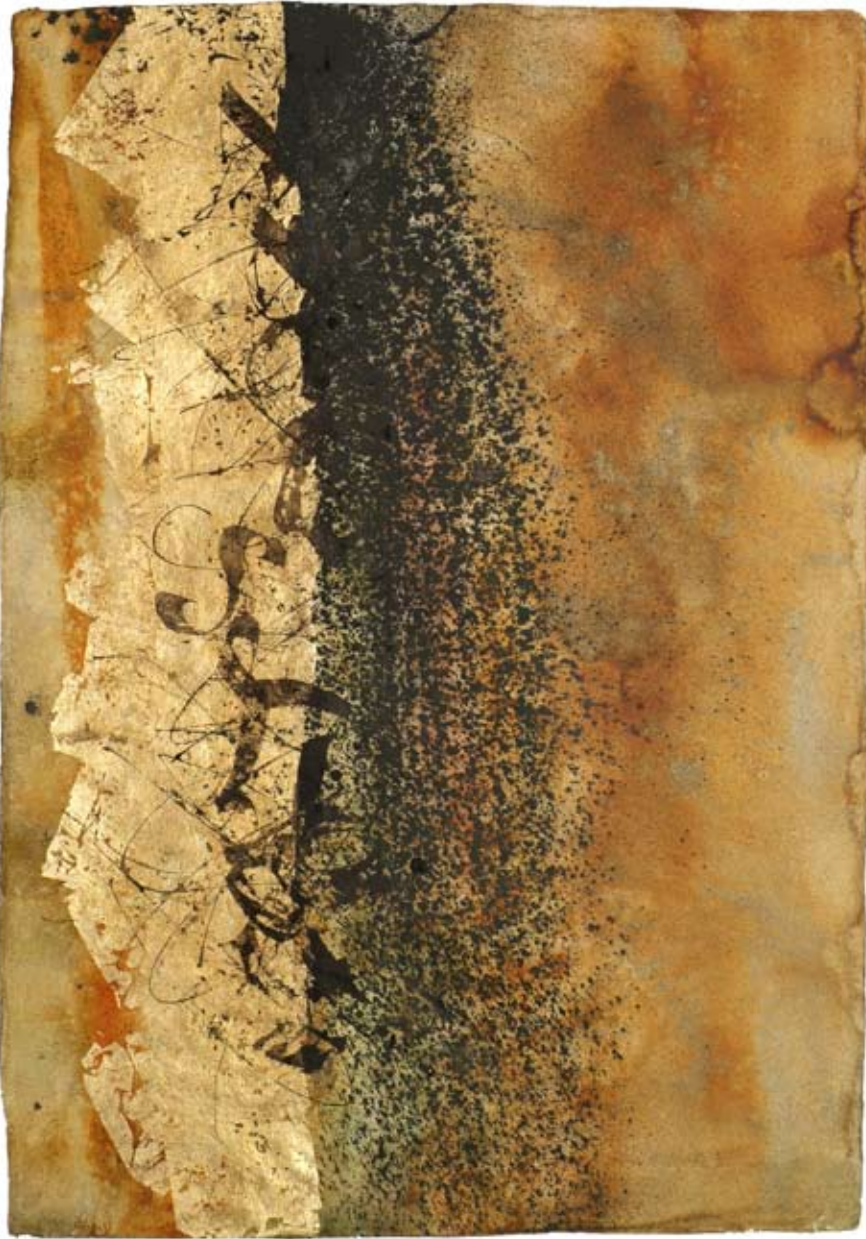
„Vertraute Sehnsüchte“, Acryl und Schlagmetall auf handgeschöpftem Papier, ca. 94 x 134 cm, 2008