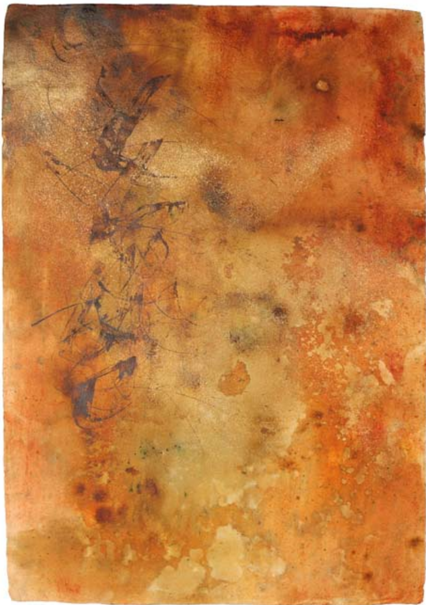
„Gelebte Träume“, Acryl und Schlagmetall auf handgeschöpftem Papier, ca. 94 x 134 cm, 2008