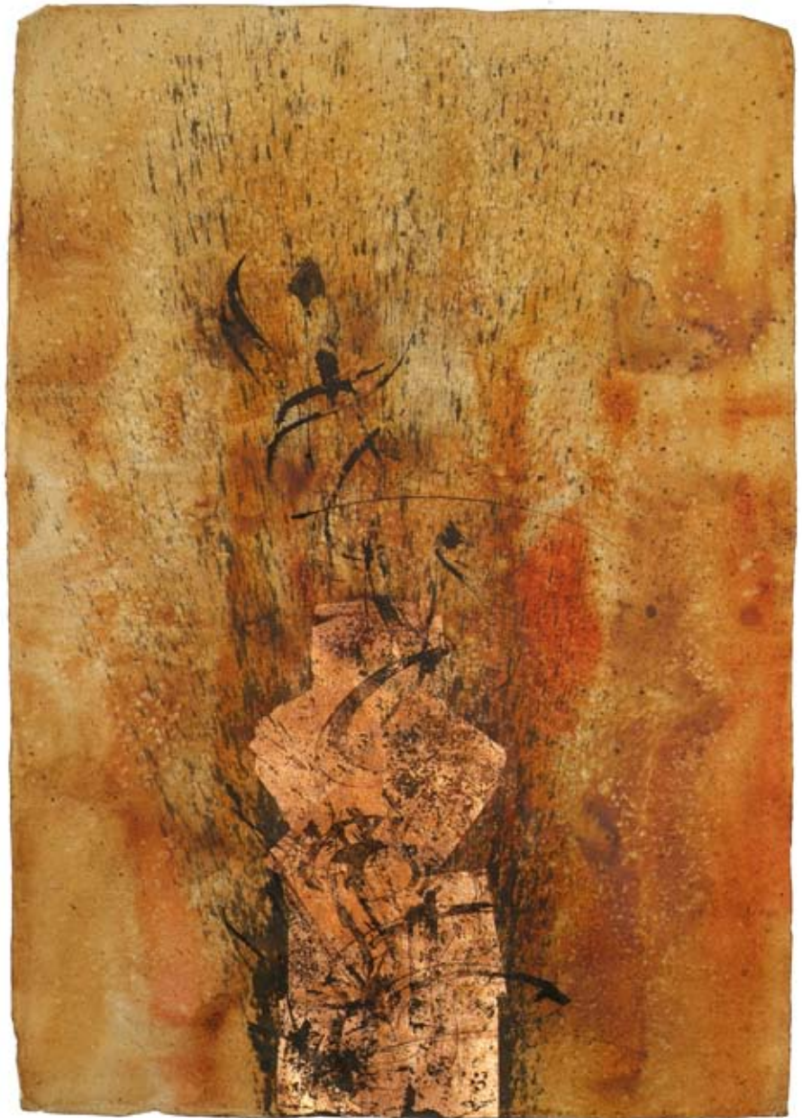
„Versprochene Liebe“, Acryl und Schlagmetall auf handgeschöpftem Papier, ca. 94 x 134 cm, 2008