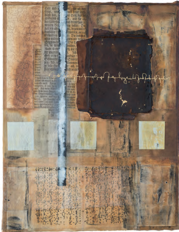
Mari Emily Bohley: »Durchdrungen« Collage und Blattgold auf Papier, 50 x 65 cm, 2015

und lädt Sie herzlich zur Eröffnung am Samstag, 9. September 2017 um 14 Uhr ein.